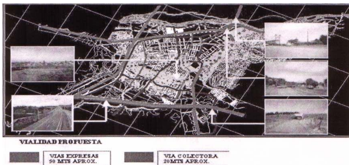
Figura N° 2

7.- En el numeral 4. 1.1 "Vialidad Estructurante", del capítulo 4, de la Memoria del Plan Regulador, no se incluye la apertura de la vía Circunvalación entre Ruta Huichahue- el Tramo 5-6, del Plan Regulador. Ver figura N° 2.